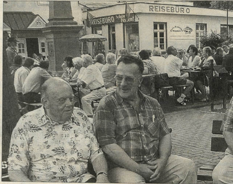
Jeden Morgen ab zehn Uhr ist die „Rentnerbank“ besetzt. Doch um zwölf Uhr