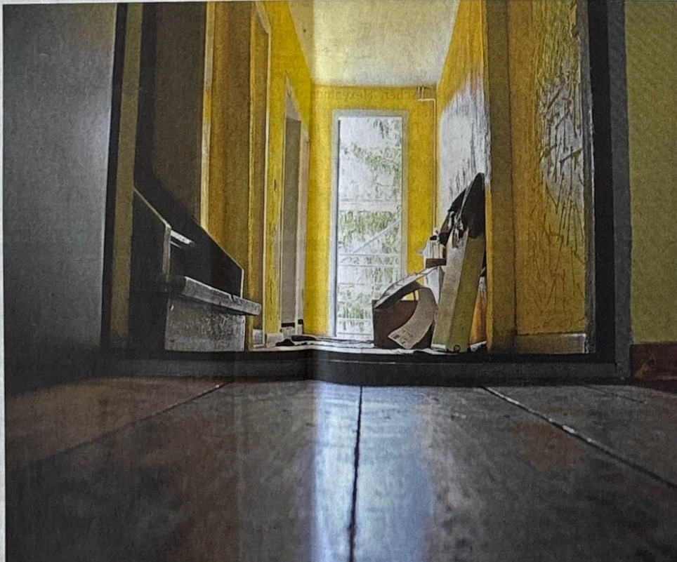
Während das Äußere des Gebäudes schon nahezu fertig ist, wird im Inneren noch fleißig gearbeitet. Das untere Stockwerk soll komplett barrierefrei werden.