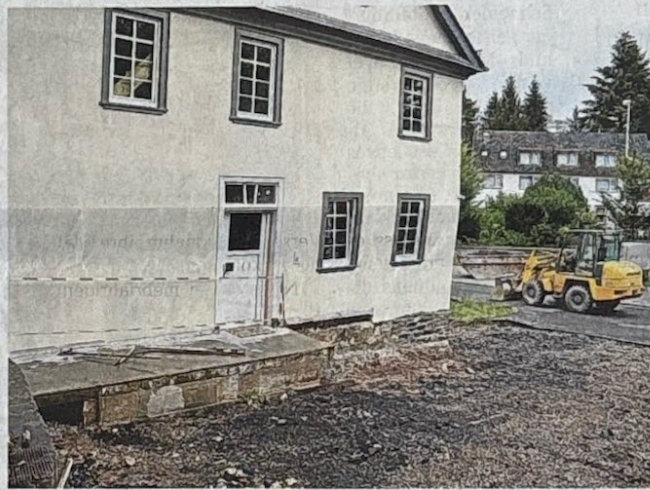
Die Eingangstür ist zu eng, um beispielsweise mit einem Rollstuhl hereinzufahren, deshalb wird eine neue und breitere eingebaut. Der Balkon über dem Eingangsbereich ist bereits verschwunden.

Wie von der Aufsichts- und Dienstleistungsdirektion (ADD) gefordert, werden der Eingang und das komplette untere Stockwerk barrierefrei. Seit Jahren schon war die Sanierung des Jugendhauses geplant. Kurz bevor es losgehen sollte, machte die ADD die entsprechende Auflage. Hätte die Stadt diese nicht eingehalten, wäre die Förderung weggefallen. Sicherlich ein Problem, denn die Maßnahme schlägt sich nicht unerheblich im städtischen Etat nieder. 70 000 Euro waren ursprünglich im Haushalt für die Sanierung der Hahnenmühle eingeplant. Nach der Ausschreibung stand dann fest, dass das gesamte Projekt deutlich mehr als 100 000 Euro kosten wird. Nicht nur die Barrierefreiheit schlägt zu Bu-