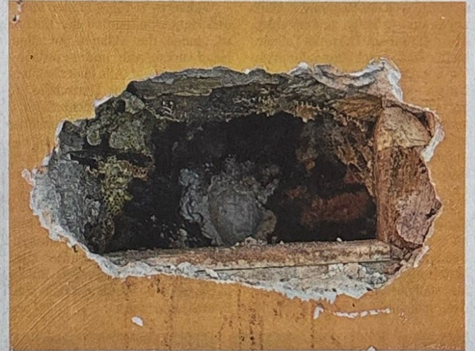
In der Wand im Wohnzimmer klafft ein großes Loch. Dort haben Tausende von Bienen ein Zuhause gefunden.