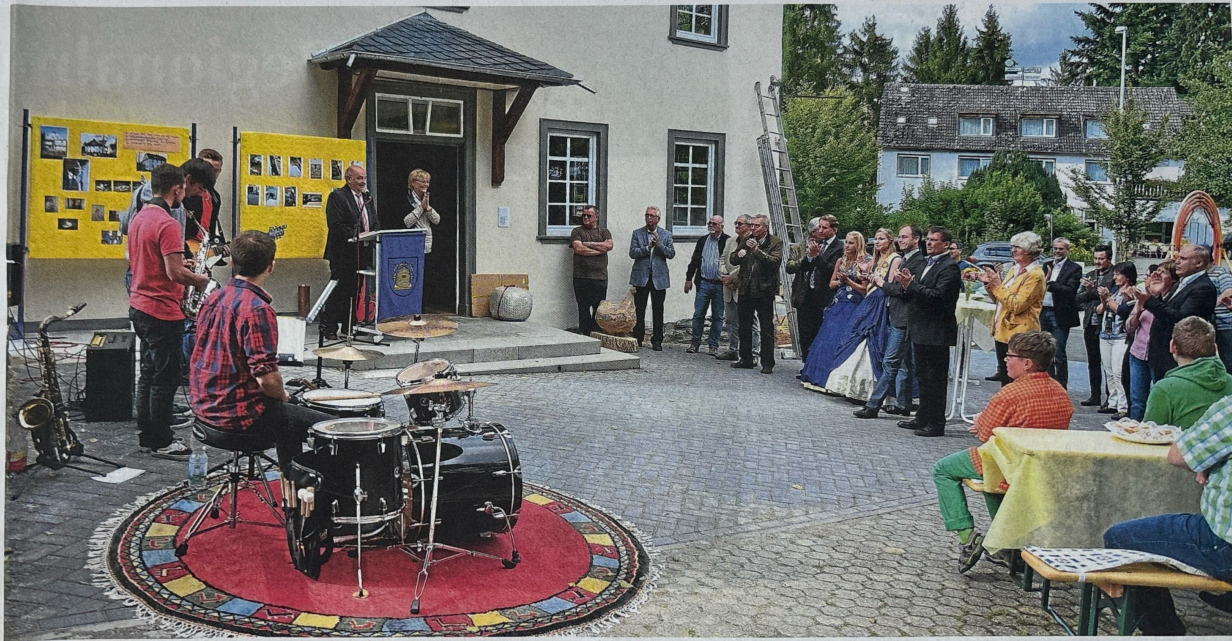
Ein freudiger Anlass, zu dem zahlreiche Gäste gern gekommen waren: Gemeinsam wurde am Freitag die Sanierung des Jugendhauses Hahnenmühle gefeiert.

■ Nastätten. Es war ein besonderes Ereignis, nicht nur für die Stadt Nastätten, sondern für die ganze Verbandsgemeinde. Am Freitag haben die Mitarbeiter des Jugendhauses Hahnenmühle gemeinsam mit Vertretern der Politik, der Verwaltung, der Kirchen, der Schulen, dem Architekten, den beteiligten Firmen und weiteren Gästen die nahezu abgeschlossene Sanierung der Einrichtung gefeiert. Auch viele Kinder tobten an dem Nachmittag in dem und um das Jugendhaus – nur eine Unterstreichung der hohen Bedeutung, die es genießt. Mehrere Hunderttausend Euro haben die Arbeiten letztendlich gekostet; Geld, das die Verantwortlichen aber gern in die Hand genommen haben. Denn die Hahnenmühle ist ein echtes Prachtstück geworden – und nun außerdem barrierefrei zugänglich. me