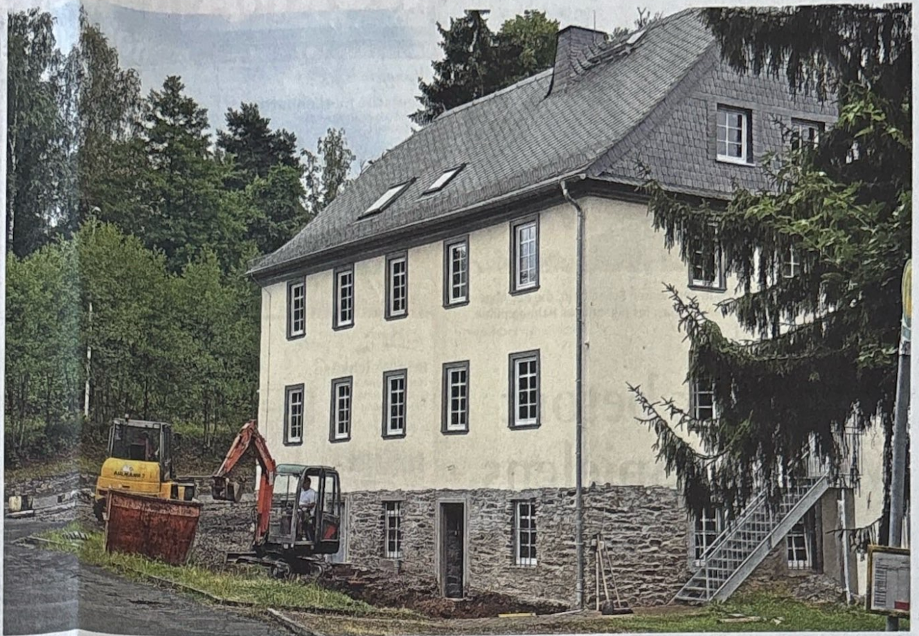
Schön sieht es aus, das frisch gestrichene Jugendhaus Hahnenmühle. Vergangene Woche ist das Gerüst abgebaut worden, sodass das Gebäude nun richtig zur Geltung kommen kann.