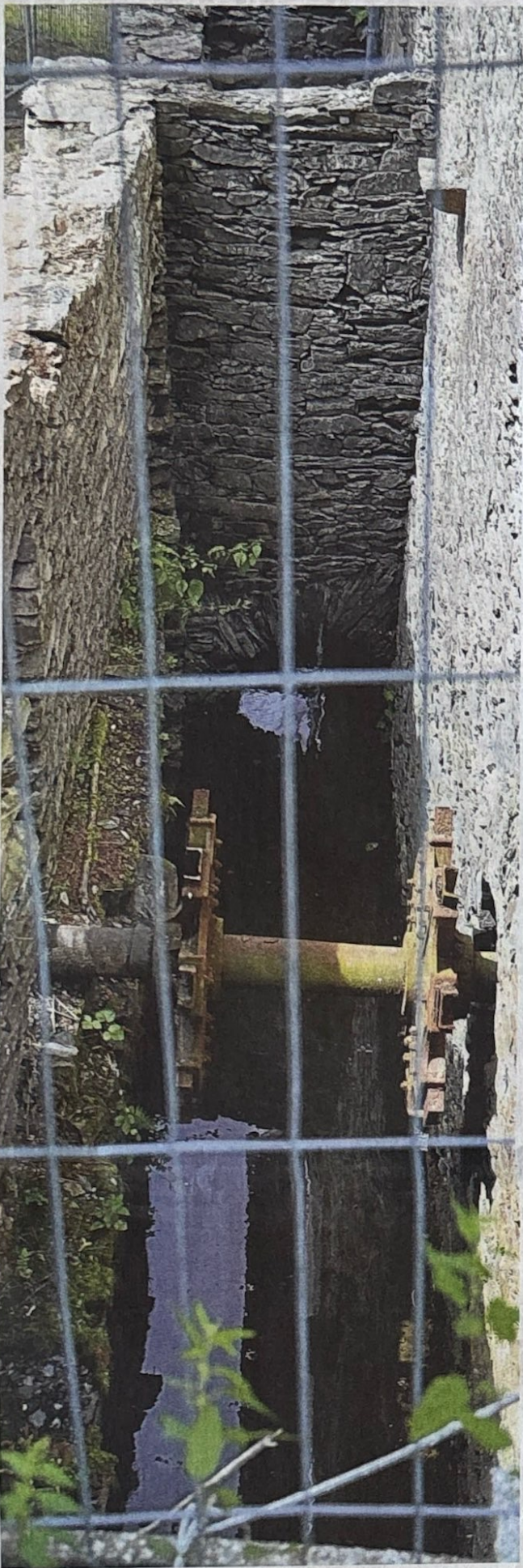
Der alte Mühlgraben im hinteren Bereich des Jugendhauses ist noch gut erhalten. Auch das Mühlrad gibt es noch. Nach den aktuellen Planungen soll der Bereich schöner und sichtbarer gestaltet werden.