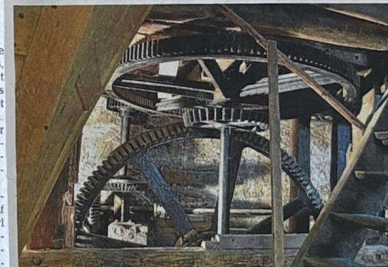
Die alte Mühlentechnik ist nahezu komplett erhalten – vom Keller bis ins Dachgeschoss. Das soll auch weiterhin so sein.

„Das Jugendhaus Hahnenmühle muss ein Haus der Begegnung werden.“