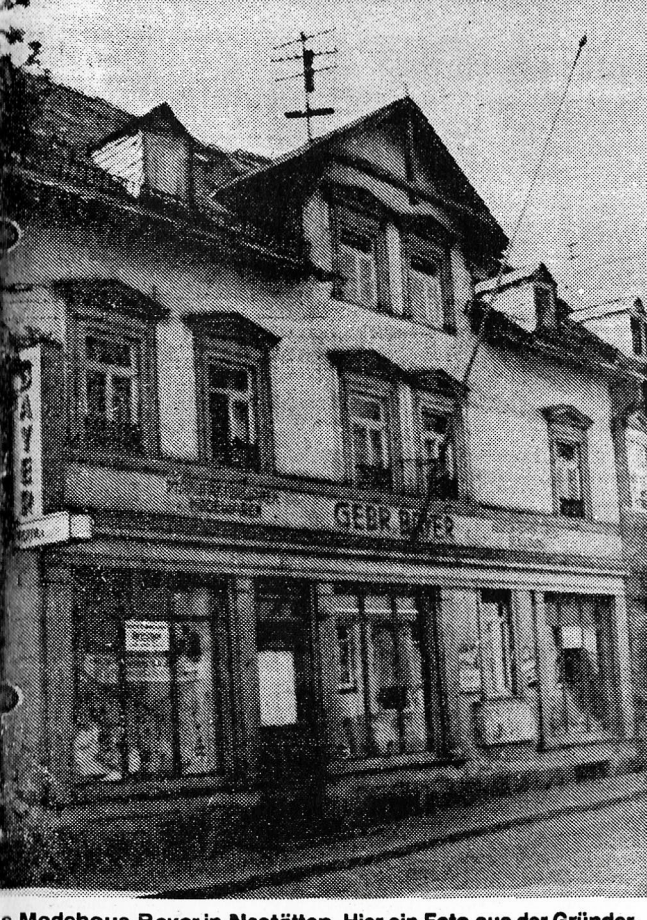
Das Modehaus Bayer in Nastätten. Hier ein Foto aus der Gründer-

zu schätzen. Über Jubiläumsangelegenheiten unsere Leser auf der Rückseite unserer Modebeilage.