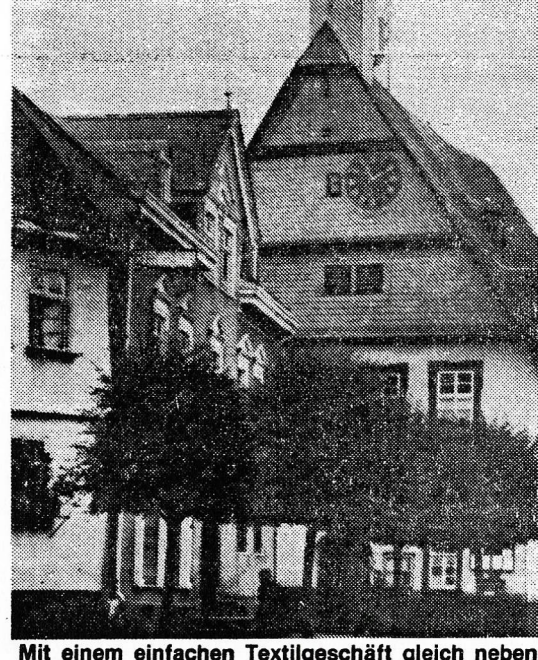
Mit einem einfachen Textilgeschäft gleich neben (Foto) legten Otto und August Bayer den Grundstein für ihren Unternehmen: dem Modehaus Bayer in Nas